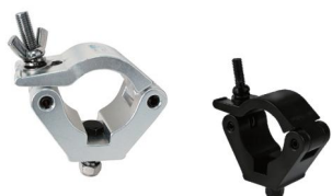
Tube: \Phi 58mm- \Phi 61mm SWL: 700kg 0.73kg