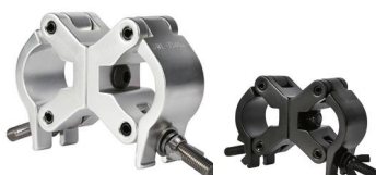
Tube: \Phi 58mm- \Phi 60mm SWL: 500kg 1.4kg