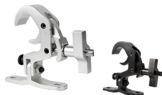
Tube: \Phi 48mm- \Phi 51mm SWL: 150kg 0.6kg