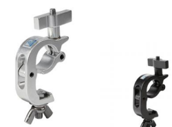
MODEL NO.: GE314/B