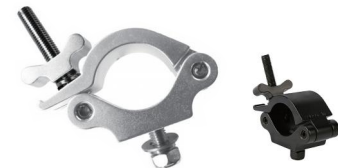
MODEL NO.: GE535/B

Tube: \Phi 48\text{mm}-\Phi 51\text{mm} SWL: 500kg 0.55kg