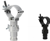
MODEL NO.: GE512T/B