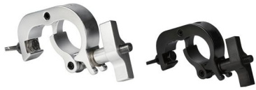
MODEL NO.: GE528/B

Tube: \Phi 48\text{mm}-\Phi 51\text{mm} SWL: 250kg 0.47kg