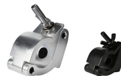
MODEL NO.: GE545/B

Tube: \Phi 48\text{mm}-\Phi 51\text{mm} SWL: 500kg 0.6kg