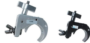
MODEL NO.: GE530/B

Tube: \Phi 48\text{mm}-\Phi 51\text{mm} SWL: 100kg 0.29kg