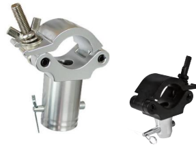
Tube: \Phi 48mm- \Phi 51mm SWL: 200kg 0.787kg