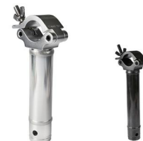
MODEL NO.: GE539/B

Tube: \Phi 48\text{mm}-\Phi 51\text{mm} SWL: 100kg 0.94kg