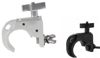
MODEL NO.: GE530-1/B

Tube: \Phi 48\text{mm}-\Phi 51\text{mm} SWL: 200kg 0.3kg