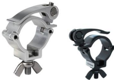
MODEL NO.: GE512QUICK/B