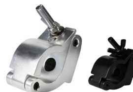
Tube: \Phi 48mm- \Phi 51mm SWL: 500kg 0.6kg