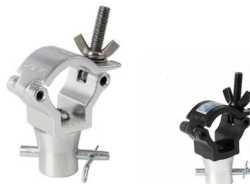
MODEL NO.: GE312A/B