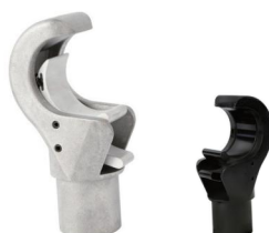
MODEL NO.: GE503/B

Tube: \Phi 35\text{mm}-\Phi 36\text{mm} Tube: \Phi 48\text{mm}-\Phi 49\text{mm} Tube: \Phi 50\text{mm}-\Phi 51\text{mm} 0.173kg 0.38kg 0.4kg