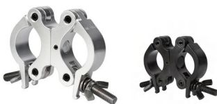
MODEL NO.: GE518D/B