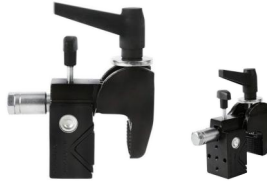
MODEL NO.: GE502/B