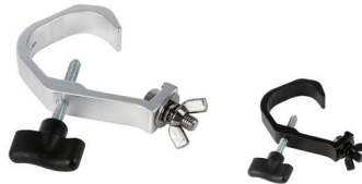
MODEL NO.: GE531/B

Tube: \Phi 48\text{mm}-\Phi 51\text{mm} SWL: 50kg 0.19kg