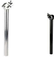
Tube: \Phi 48mm- \Phi 51mm SWL: 500kg 0.906kg