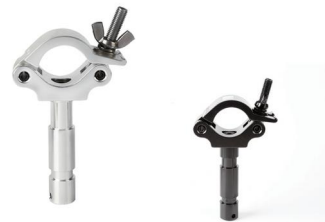
Tube: \Phi 48mm- \Phi 51mm SWL: 200kg 0.65kg