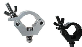
Tube: \Phi 48mm- \Phi 51mm SWL: 300kg 0.41kg