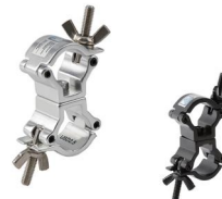
MODEL NO.: GE210D/B