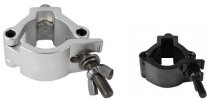
MODEL NO.: GE517/B