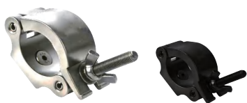
Tube: \Phi 58mm- \Phi 60mm SWL: 500kg 0.57kg