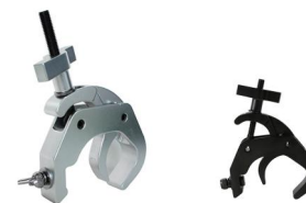
Tube: \Phi 48mm- \Phi 80mm SWL: 150kg 1.02kg