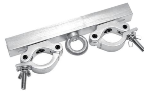
MODEL NO.: GE5007/B