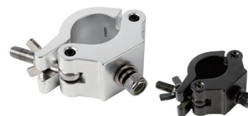
Tube: \Phi 48mm- \Phi 51mm SWL: 750kg 0.62kg