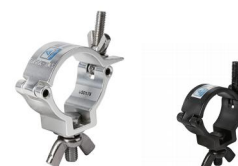
MODEL NO.: GE512/B

Tube: \Phi 48\text{mm}-\Phi 51\text{mm} SWL: 100kg 0.168kg