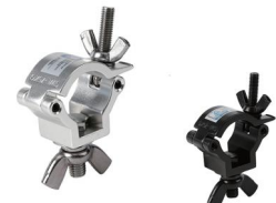
MODEL NO.: GE210/B