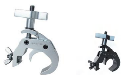
MODEL NO.: GE527(500)/B

Tube: \Phi 48\text{mm}-\Phi 51\text{mm} SWL: 500kg 0.55kg