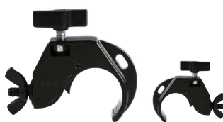
MODEL NO.: GE501/B

Tube: \Phi 48\text{mm}-\Phi 51\text{mm} SWL: 25kg 0.26kg