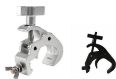
MODEL NO.: GE316/B

Tube: \Phi 30\text{mm}-\Phi 41\text{mm} SWL: 50kg 0.215kg