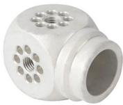
MODEL NO.: CUBE