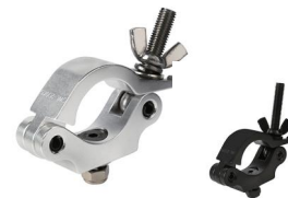
MODEL NO.: GE518/B