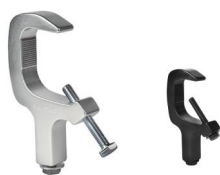
MODEL NO.: GE546/B

Tube: \Phi 48\text{mm}-\Phi 51\text{mm} SWL: 250kg 0.37kg