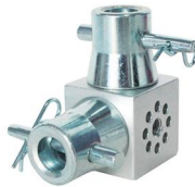
MODEL NO.: GE1001-FS24/34