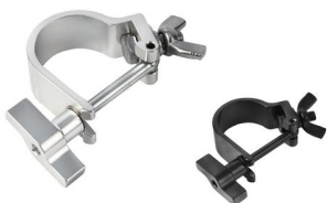
MODEL NO.: GE536/B

Tube: \Phi 48\text{mm}-\Phi 51\text{mm} SWL: 100kg 0.19kg