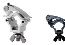
MODEL NO.: GE312QUICK/B