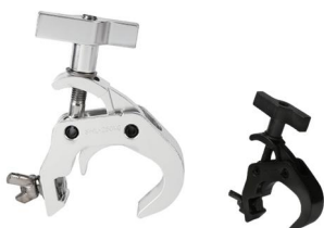
Tube: \Phi 48mm- \Phi 51mm SWL: 250kg 0.495kg