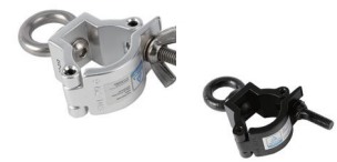
MODEL NO.: GE313/B