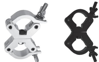
Tube: \Phi 48mm- \Phi 51mm SWL: 300vkg 0.75kg