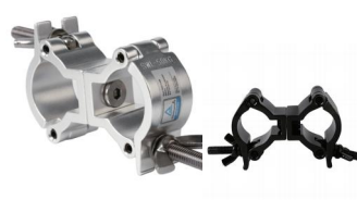
MODEL NO.: GE312D/B