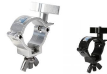
MODEL NO.: GE512IN/B