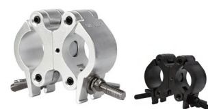
MODEL NO.: GE521D/B