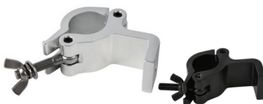
Tube: \Phi 48mm- \Phi 51mm SWL: 300kg 0.59kg