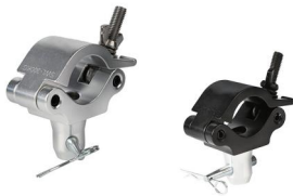
Tube: \Phi 48mm- \Phi 51mm SWL: 200kg 0.615kg