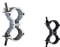
MODEL NO.: GE512D/B

Tube: \Phi 48\text{mm}-\Phi 51\text{mm} SWL: 100kg 0.23kg