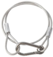
MODEL NO.: SAFETY ROPE