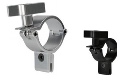
MODEL NO.: GE513IN/B