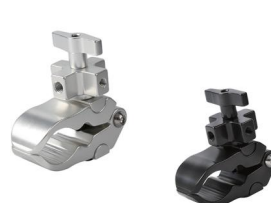
MODEL NO.: GE317/B