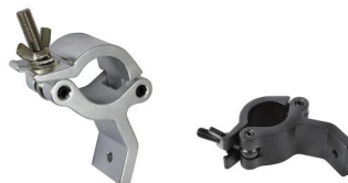
MODEL NO.: GE533/B

Tube: \Phi 48\text{mm}-\Phi 51\text{mm} SWL: 300kg 0.56kg