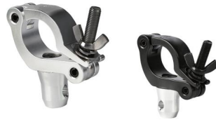
MODEL NO.: GE529/B

Tube: \Phi 48\text{mm}-\Phi 51\text{mm} SWL: 10kg 0.031kg