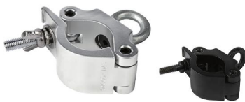
Tube: \Phi 48mm- \Phi 51mm SWL: 200kg 0.58kg