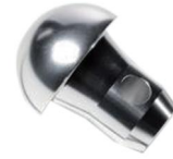
MODEL NO.: GE1002-FS24/34