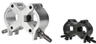
MODEL NO.: GE532D/B

Tube: \Phi 48\text{mm}-\Phi 51\text{mm} SWL: 750kg 1.13kg