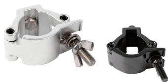
Tube: \Phi 48mm- \Phi 51mm SWL: 500kg 0.44kg