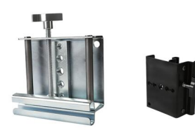
MODEL NO.: GE504/A/B