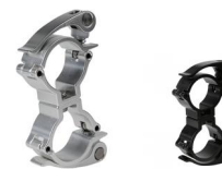
MODEL NO.: GE512QUICKD/B

Tube: \Phi 48\text{mm}-\Phi 51\text{mm} SWL: 100kg 0.285kg