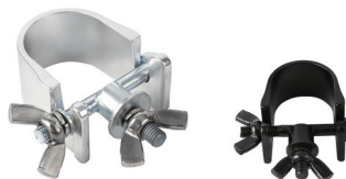
MODEL NO.: GE537/B

Tube: \Phi 48\text{mm}-\Phi 51\text{mm} SWL: 200kg 0.27kg