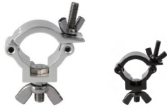
MODEL NO.: GE512-40/B