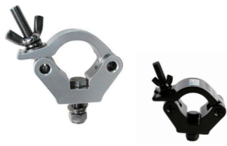
Tube: \Phi 48mm- \Phi 51mm SWL: 300kg 0.41kg