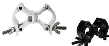
Tube: \Phi 48mm- \Phi 51mm SWL: 500kg 0.8kg