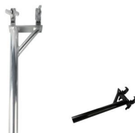
MODEL NO.: GE527Y/B

Tube: \Phi 48\text{mm}-\Phi 51\text{mm} SWL: 40kg 1.9kg