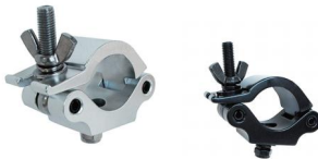
MODEL NO.: GE521/B