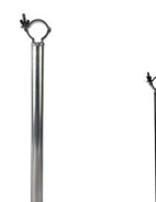
MODEL NO.: GE312I/B