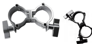
MODEL NO.: GE512IN/B

Tube: \Phi 48\text{mm}-\Phi 51\text{mm} SWL: 100kg 0.26kg