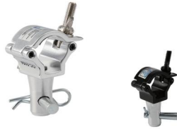
MODEL NO.: GE210A/B