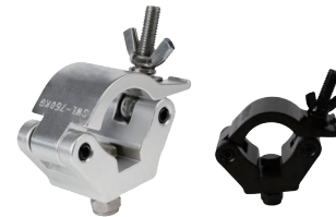
MODEL NO.: GE532/B

Tube: \Phi 48\text{mm}-\Phi 51\text{mm} SWL: 750kg 0.6kg