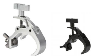
Tube: \Phi 48mm- \Phi 51mm SWL: 50kg 0.27kg