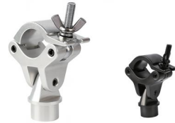
Tube: \Phi 48mm- \Phi 51mm SWL: 200kg 0.7kg