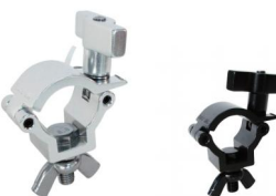
MODEL NO.: GE312IN/B