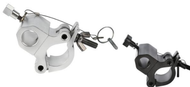
Tube: \Phi 48mm- \Phi 51mm SWL: 100kg 0.92kg