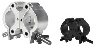
Tube: \Phi 48mm- \Phi 51mm SWL: 500kg 1.05kg