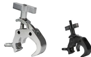
Tube: \Phi 48mm- \Phi 51mm SWL: 500kg 0.56kg